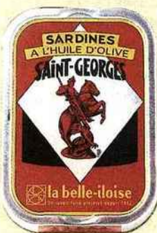
Les sardines La belle-iloise.