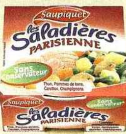
Les salades de Saupiquet.