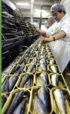
Ligne de production de l'usine Connétable à Douarnenez, en 2003.

ces opérations minutieuses. Les techniques et le savoir-faire se transmettent de mère en fille. D'ailleurs, certaines familles de Douarnenez travaillent au sein de la conserverie depuis des générations. Aujourd'hui, les femmes représentent environ 85 % du personnel, soit près de 280 personnes. En 2003, pour son 150 e anniversaire, l'entreprise Wenceslas Chancerelle a offert à la ville de Douarnenez une statue faite de granit et de bronze qui rend hommage à toutes les petites mains qui ont fait le succès de la société. Mi-femme, mi-sardine, cette sculpture sera inaugurée sur le port