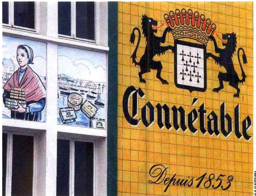
La façade de la conserverie Connétable et ses fresques peintes, dans le quartier du port de pêche de Douarnenez.

Avec un chiffre d'affaires d'environ 85 millions d'euros, la société Wenceslas Chancerelle est la plus ancienne conserverie du monde. Depuis plus de 150 ans, la famille Chancerelle ne cesse d'innover et de proposer de nouvelles recettes pour satisfaire le plus grand nombre avec Connétable , leur marque phare.